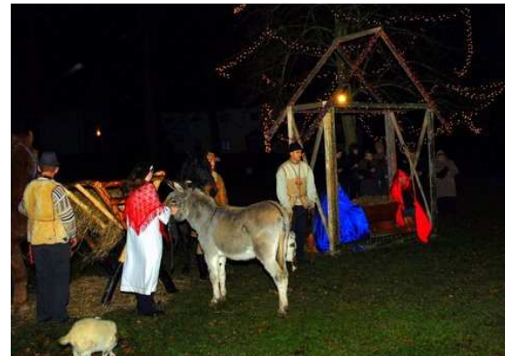
Niespodzianka późną porą: Żłobek przed Pałacem. / Überraschung zu später Stunde: Ein kleines Krippenspiel vor dem Schloss.