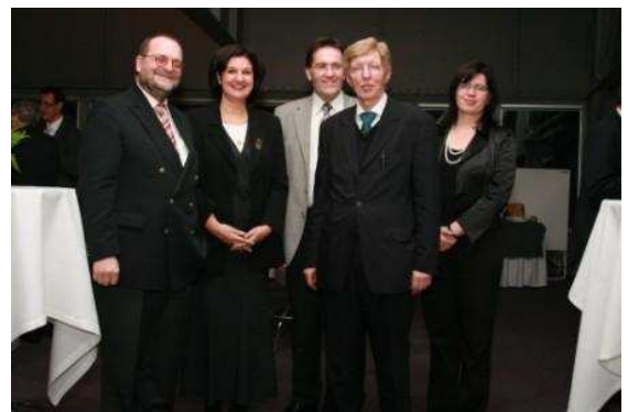
Wrocław i Poznań na rzecz środowiska / Breslau und Posen im Umwelteinsatz

Liczni przedstawiciele instytucji i przedsiębiorstw komunalnych z Wielkopolski, lecz także wielu wystawców i gości targowych z Niemiec przyjęło zaproszenie na dyskusję i nieformalną wymianę doświadczeń wieczorem, trzeciego dnia targów. Tegoroczne targi ekologiczne została przez obecnych oceniona jak najbardziej pozytywnie. Członkowie Polsko-Niemieckiego Koła Gospodarczego, razem z przedstawicielami Konsulatu Generalnego i Dolnej Saksonii, odpowiadali tego wieczoru na pytania gości na wspólnym stoisku informacyjnym. Przyjęcie Konsulatu Generalnego z okazji POLEKO zostało w tym roku zorganizowane wspólnie z Dolną Saksonią, która zaprezentowała się polskim przedsiębiorcom jako atrakcyjna i innowacyjna lokalizacja.