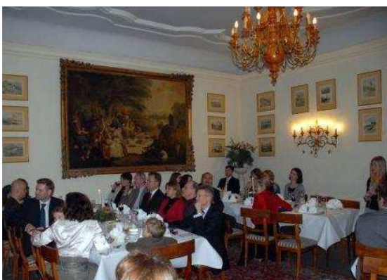
Ein wahres Festmahl! / Prawdziwa uczta !