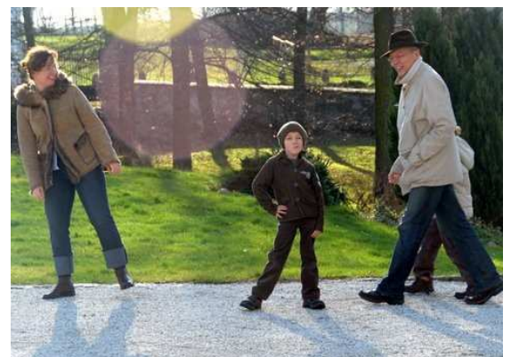
Dzień później / Der Tag danach