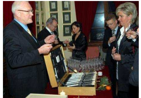
Hmmm ! / Tief ins Glas geschaut