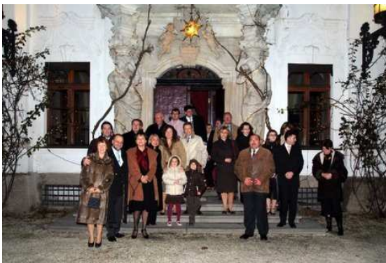
Gruppenbild mit Kindern und Damen Zdjęcie grupowe z damami i dziećmi