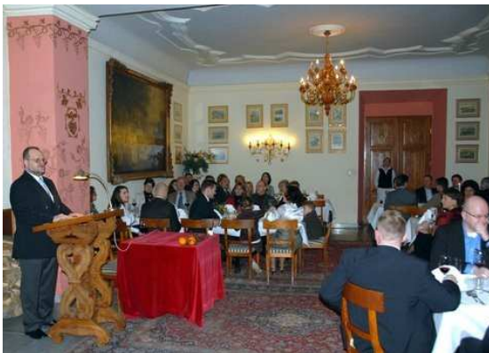
Die Weihnachtsansprache: / Bożonarodzeniowa przemowa: Der Präsident in seinem Element