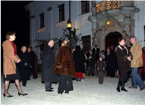
Die Gäste treffen ein: Glühwein und Schmalzbrote zur Begrüßung Przybywają goście: Na powitanie grzaniec i chleb ze smalcem