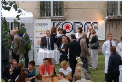
Korff Isolmatic Sp. z o.o.

Die Mitgliedsunternehmen des EUROPA FORUM leisteten wie bereits in den vergangenen Jahren einen starken organisatorischen und finanziellen Beitrag zur Gesamtveranstaltung durch die Bereitstellung eines Gemeinschaftsstandes sowie die herausgehobene Präsenz einzelner Unternehmen, die zu Gespräch und Dialog einluden.