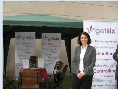
Getsix sp. z o.o.

I nawet jeśli na niebie kilka razy złowieszczę zagrzmiało, to bóg pogody także i w tym roku był łaskawie nastawiony do naszej imprezy i w ten sposób ze swej strony przyczynił się do powodzenia tego nadzwyczajnego festynu!