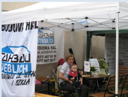
Bei Stahlbau Stieblich ist die Generationenfolge gesichert!

zorganizowanego w następujący po festynie poniedziałek.