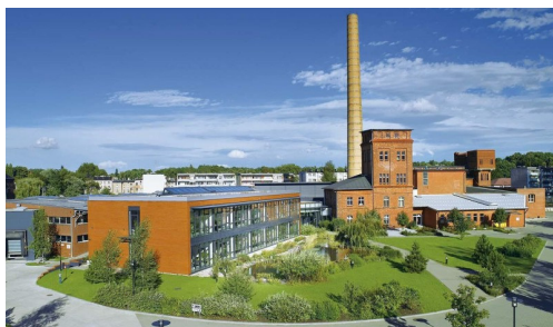
Zakład w Glucholazach