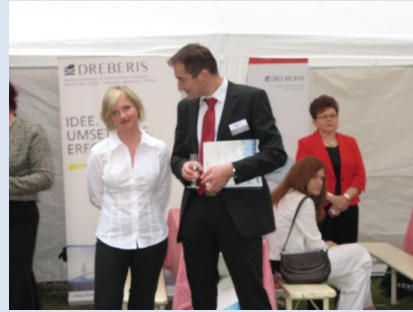
Dreberis Sp. z o.o.

Tak jak i w latach ubiegłych firmy członkowskie stowarzyszenia EUROPA FORUM wsparły całą imprezę organizacyjnie oraz finansowo, udostępniając wspólne stoisko i podkreślając obecność kilku pojedynczych przedsiębiorstw, które w swoich stoiskach zapraszały gości do rozmowy i dialogu.