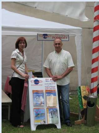
Reisebüro Fly Back